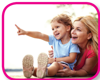
Sentence Stretchers 18-36 months