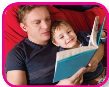
Bedtime Story 18-36 months