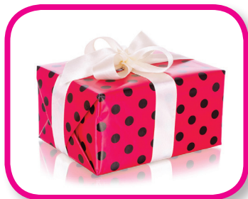
What's Inside? 18-36 months