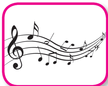
Sing a Song 18-36 months