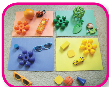
Clasificar por colores De 18 a 36 meses