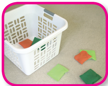
Juegos de clasificar De 18 a 36 meses