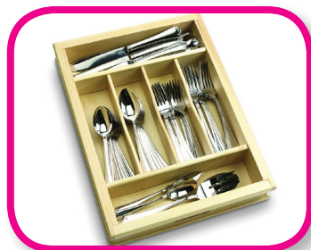
Pequeño ayudante De 18 a 36 meses