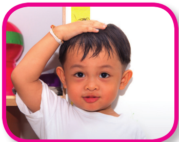
Clasificar por tamaños De 24 a 36 meses