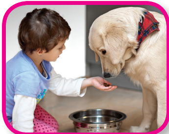
Mi propia mascota De 18 a 36 meses