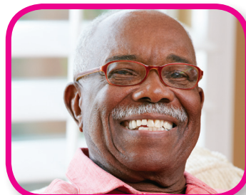
Haz sonreír a alguien De 18 a 36 meses