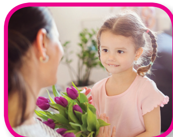
La amabilidad cuenta De 24 a 36 meses