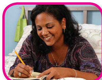
Diario de gratitud De 24 a 36 meses