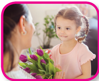
Kindness Counts 24-36 months