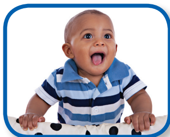
Watch Me 6-12 months