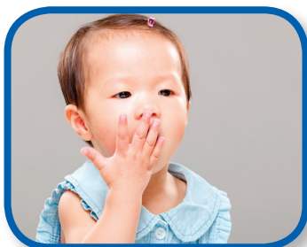
Puedo imitarte De 6 a 12 meses