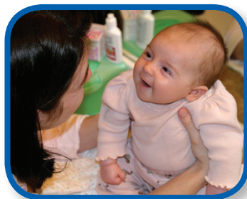
See and Do 3-6 months