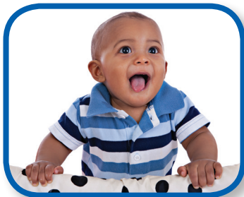
Mírame De 6 a 12 meses