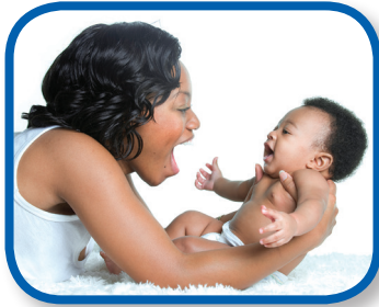
Sonidos divertidos De 0 a 3 meses