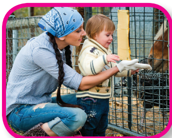
Aventuras De 18 a 36 meses