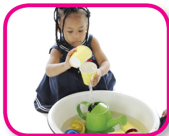
Let Your Child Lead 18-36 months