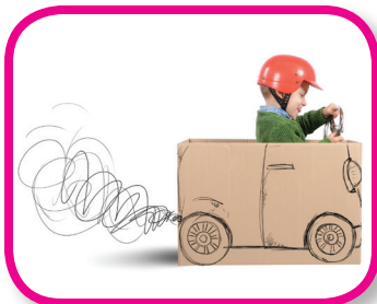
Ideas diferentes De 18 a 36 meses