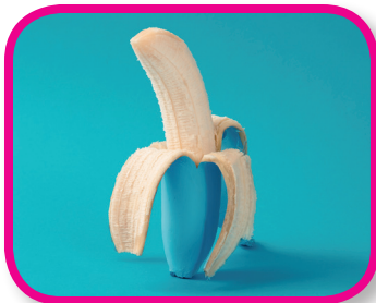
¿Qué pasa si...? De 18 a 36 meses