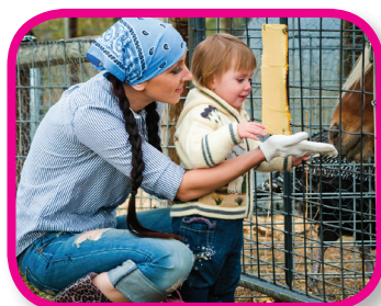
Adventures 18-36 months