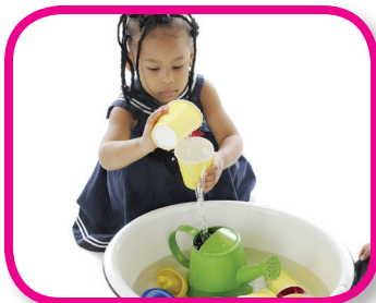
Deje que su hijo lo guíe De 18 a 36 meses