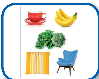
Color Viewing Station 6-12 months