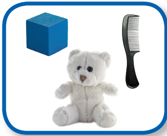
¿Ves el azul? De 0 a 3 meses