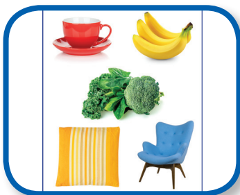
Estación para ver colores De 6 a 12 meses