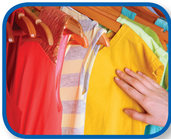
Ropa colorida De 3 a 6 meses