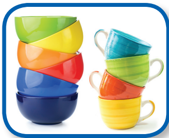
Hable sobre los colores De 3 a 6 meses